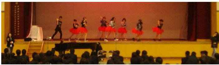
【オープニング ダンス部】