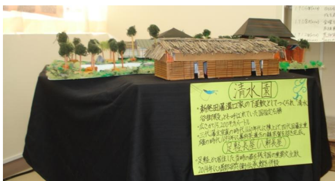
【図書委員会 新発田再発見】