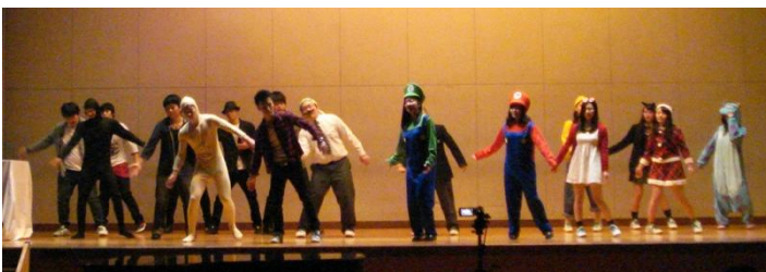
【クラス企画 ダンスパフォーマンス】