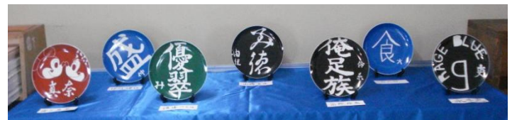
【書道選択生徒の作品展示】