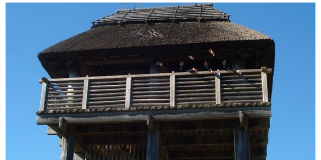
【吉野ヶ里歴史公園 物見櫓】