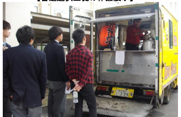
【PTA企画 屋台ラーメン“プロの味”】