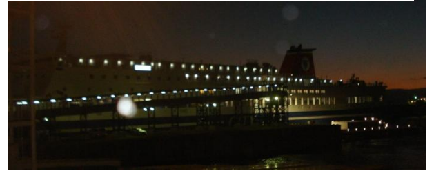
【大阪南港～門司港(フェリー)】