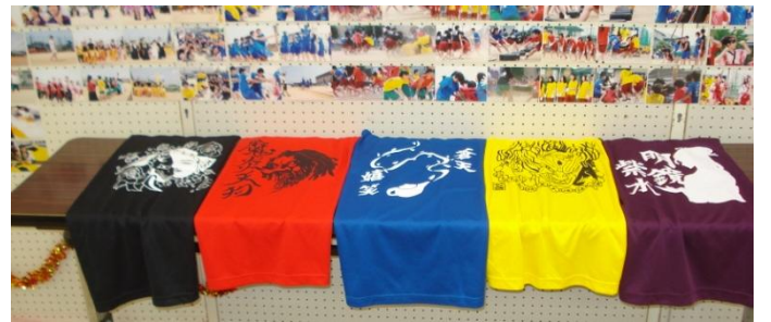
【生徒会企画 体育祭写真展】