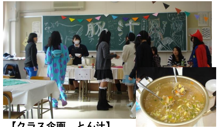
【クラス企画 とん汁】

10月31日（土）に西高祭（文化祭）を行いました。準備から当日の運営まで、生徒会が中心となり全校生徒で作り上げました。PTAからも企画に参加していただきました。体育館では、合唱部・琴部・書道部・演劇部などの部活動の発表、有志の発表もあり、多くの観客の前で精一杯のパフォーマンスを披露しました。また、音楽・美術・書道の授業での作品が展示されました。生徒たちのよい思い出・経験となった文化祭となりました。